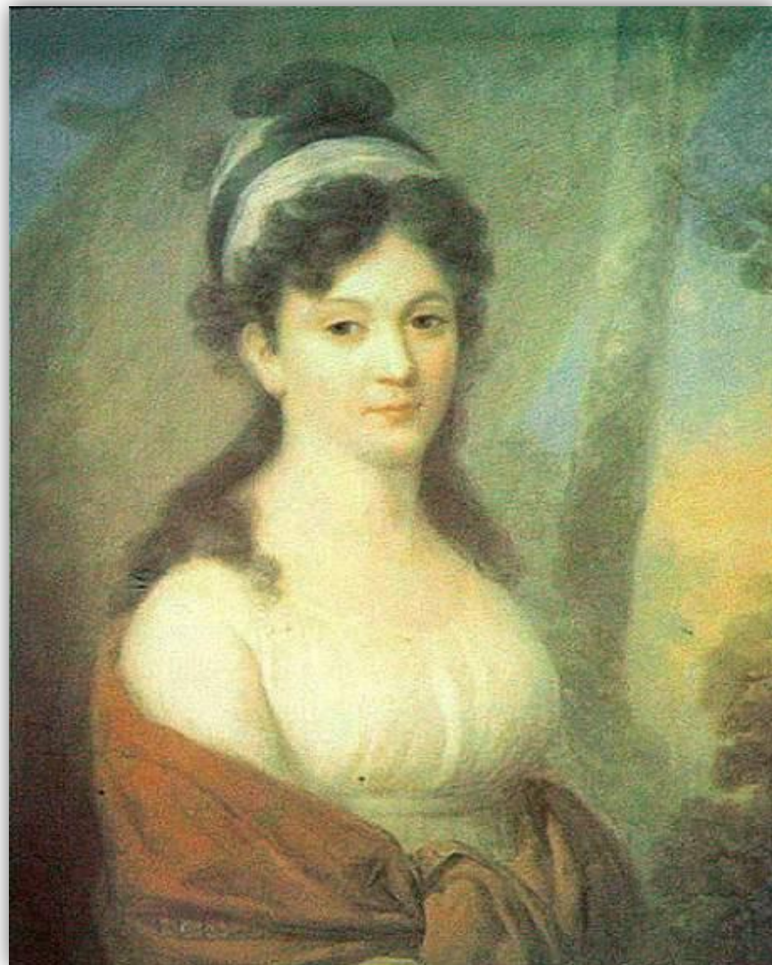
ЕКАТЕРИНА ЛЬВОВНА ТЮТЧЕВА, МАТЬ ПОЭТА.