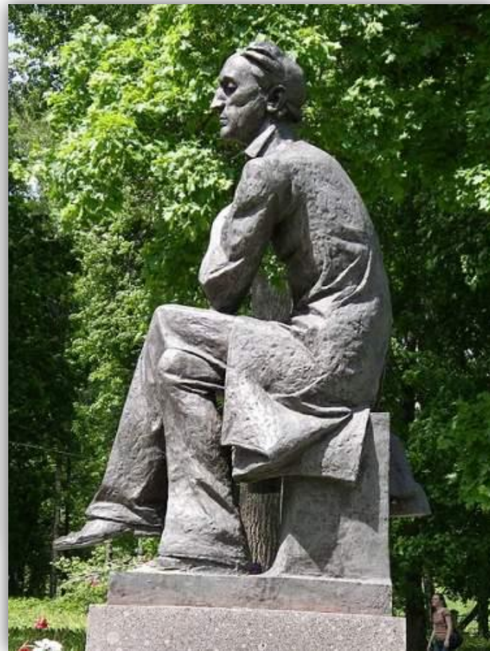
Памятник Пютчеву в музее-заповеднике «Овстуг»