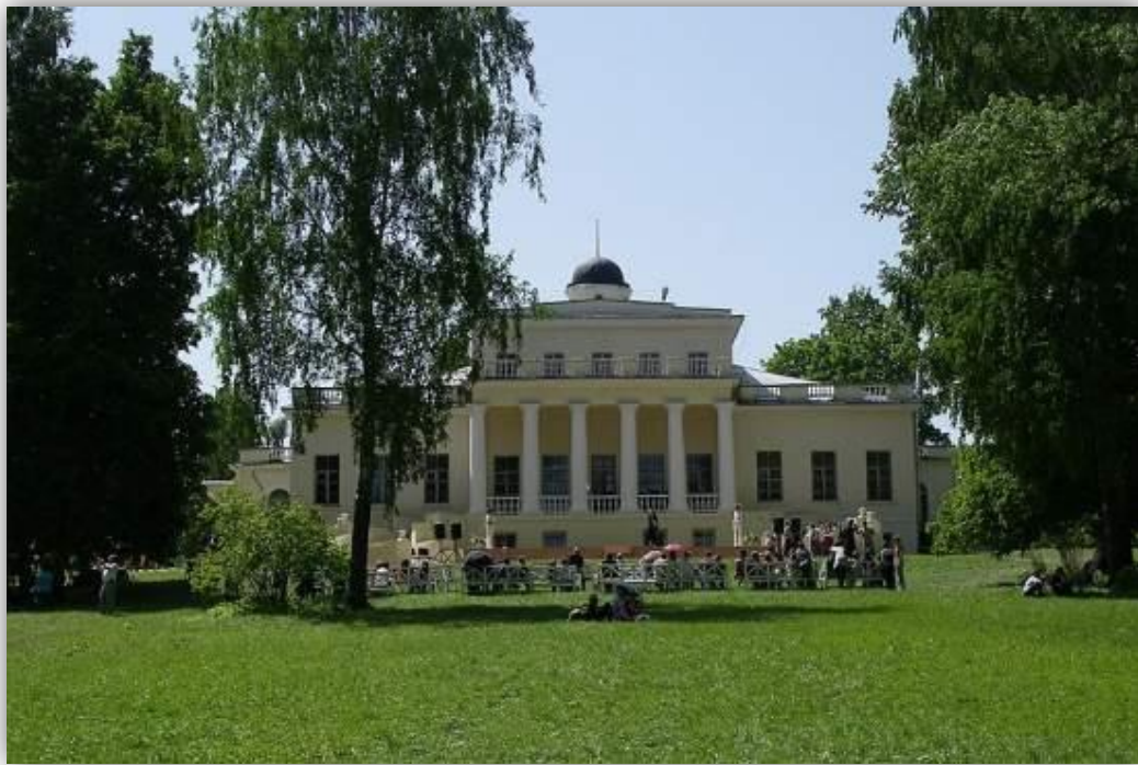
Господский дом в музее-заповеднике «Овстуг»