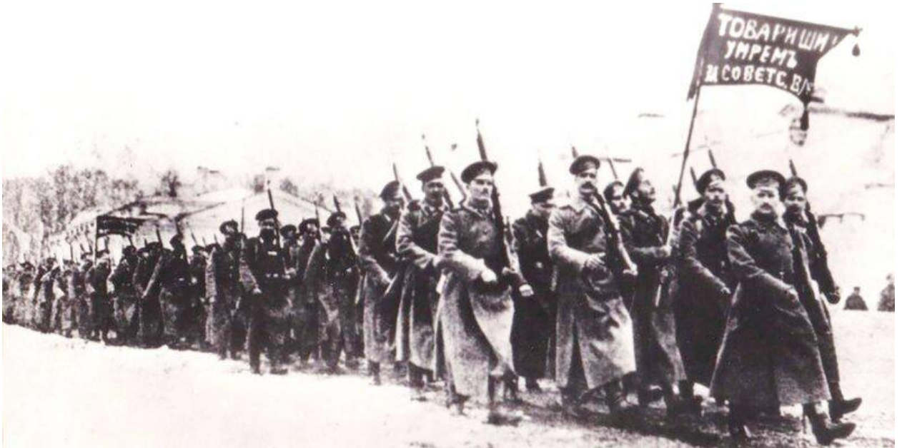
Отряд Псковских красногвардейцев. 1918 год.

23 февраля наша страна отмечает День защитника Отечества. Свое нынешнее название праздник получил только в 1995 году. Предлагаем вам узнать, как возник и менялся праздник, а также какие названия носил раньше.