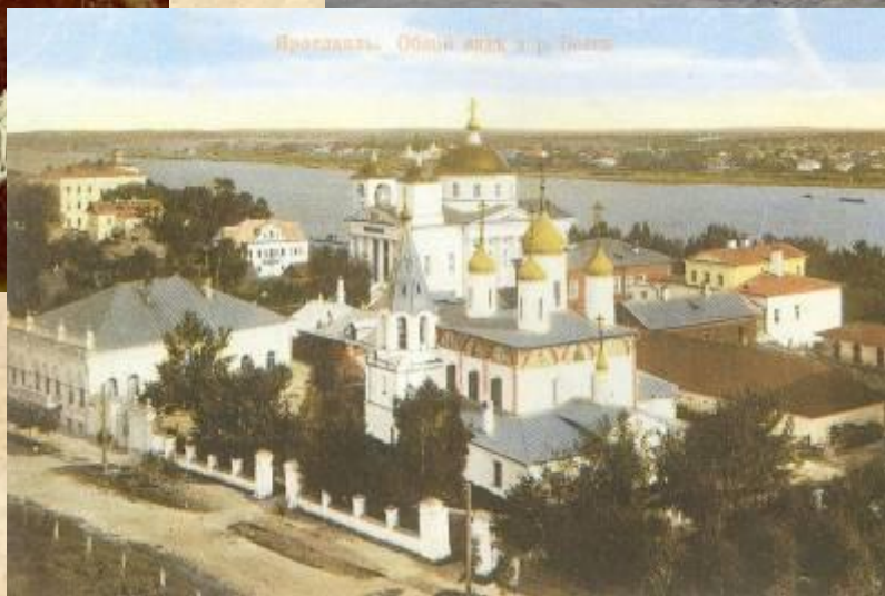
Ярославль. Общий вид и река Волга.