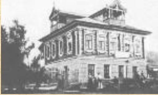
Дом-усадьба в Грешнёво