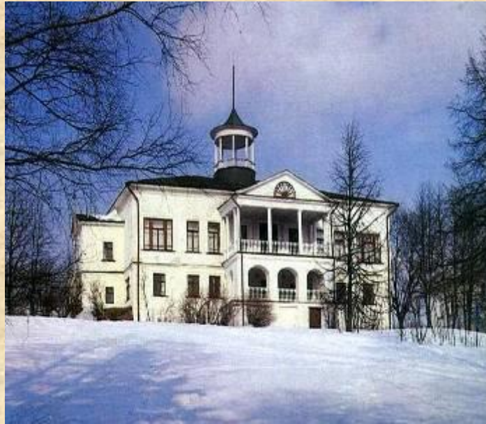
Дом-музей в Карабихе