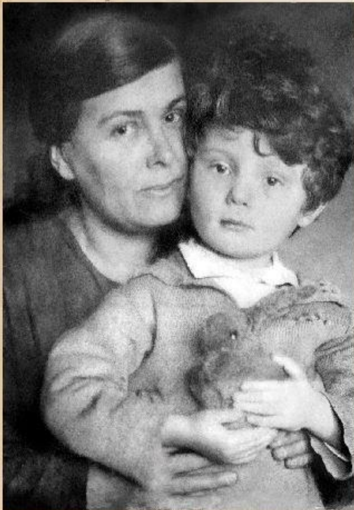
В детстве с матерью

Любовь к матери описана во многих стихах поэта: